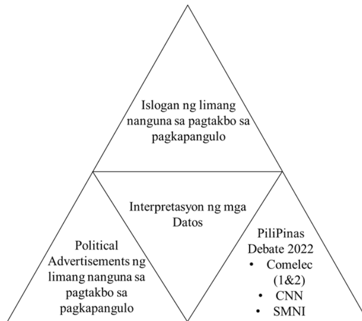
Figura 3. Triyanggulasyon ng mga Datos