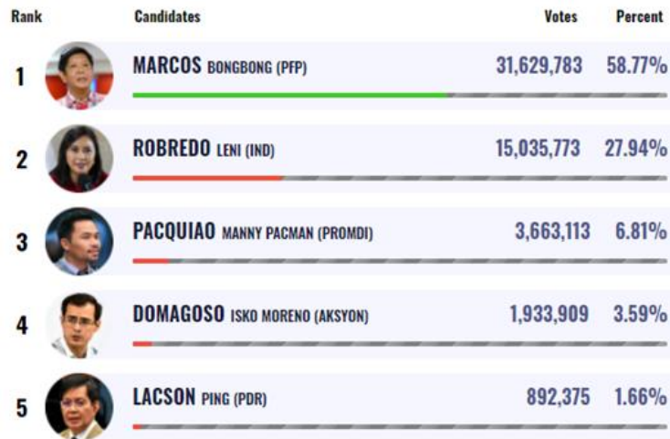
Figura 1. Mayo 25, 2022

Official results based on 171 of 173 certificates of canvass as of May 25, 2022 3:28 PM.